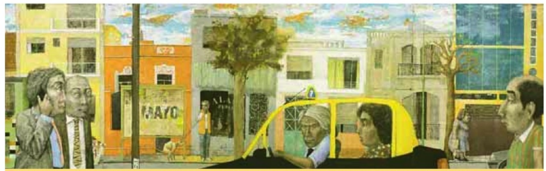
Recursos. Ambas muestras revisan la identidad de la ciudad como espacio, con referencias particulares.